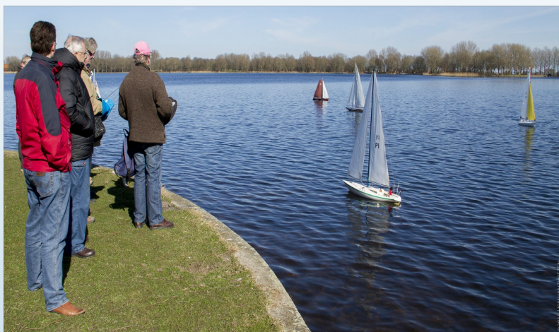
Rondje Zegerplas in Alphen a/d Rijn

Hierdoor kunnen alle clubs duidelijk zien wat er staat te gebeuren en wie wat organiseert en hopelijk ook waar er gevaren wordt en wie de contactpersoon is.