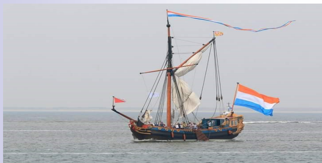
Het Statenjacht "Utrecht"