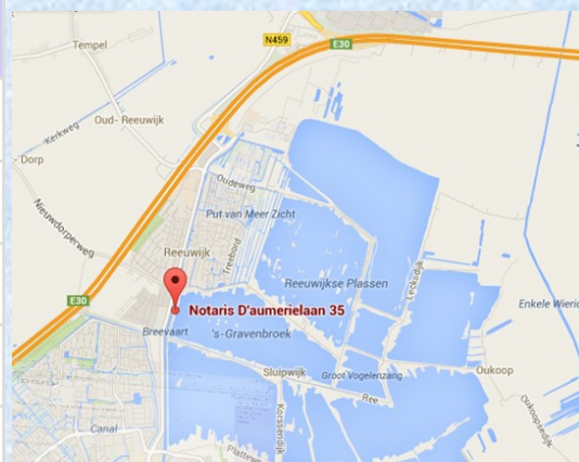
Locatie waar dit ONK wordt gevaren