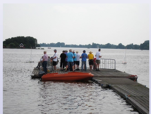
Tekst en foto's: Dirk van Berkel