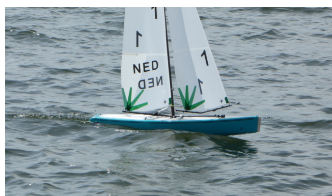
Cattenbroekerplas Woerden 20 augustus 2017.