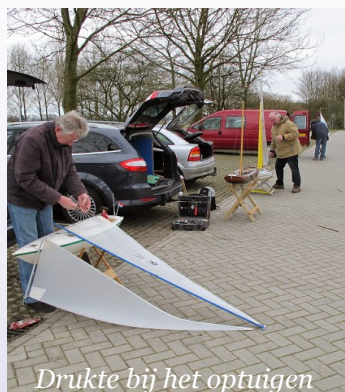
Drukke bij het optuigen

“Joost mag het weten” Toch 9 deelnemers, bewolkt, droog, wind, zon maar erg koud en afnemende wind. Een prachtige dag om het rondje Zegerplas te doen. Ondanks wat opstart problemen zoals nog snel een defecte ontvanger wisselen en