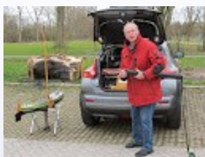
Zeilen komen hier uit een toverkoker