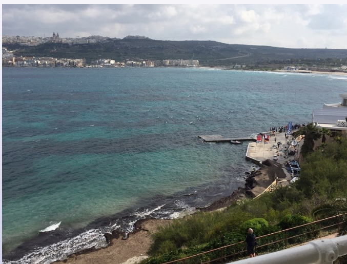
Prachtige vaarlokatie te Malta voor de IOM klasse. (1 meter klasse)