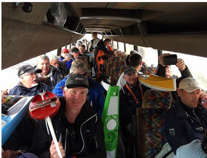
Training voor Worlds Open 2015 op Malta. Met bus naar vaarlokatie!