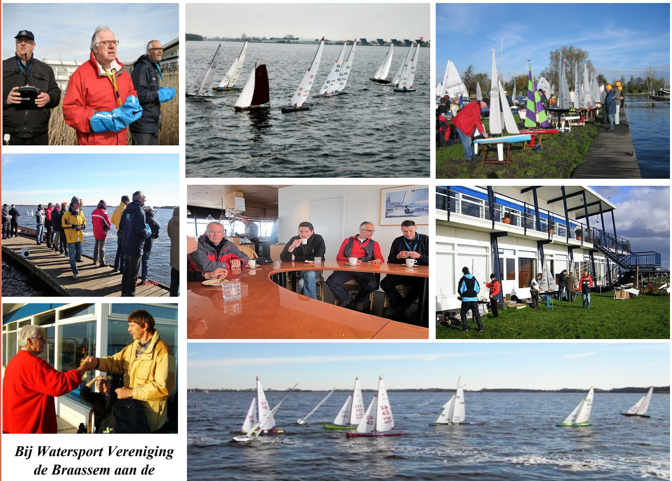
Bij Watersport Vereniging de Braassem aan de Noorderhem.